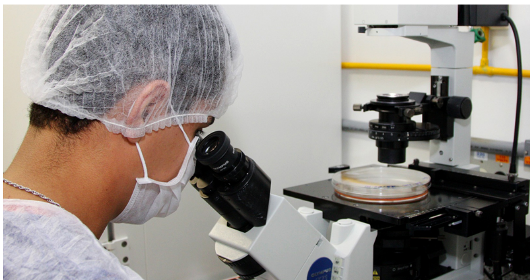
Pós-Graduação é na área de Oncologia, Células-Tronco e Terapia Celular

Estão abertas as inscrições para o Programa de Pós-Graduação em Oncologia Clínica, Células-Tronco e Terapia Celular, da Faculdade de Medicina de Ribeirão Preto (FMRP) da USP. As inscrições são presenciais e vão até o dia 30 de maio – o edital completo pode ser conferido aqui .