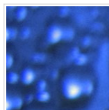
Mural da Casa da Ciência