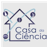
Casa da Ciência abre inscrições para pesquisadores

casa , ciência , Hemocentro , Inscrições , pesquisadores , pós-graduando