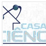
Casa da Ciência precisa de pesquisadores