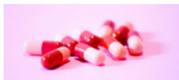
Alzheimer: Laboratório la...