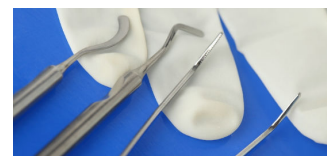
Técnicas de cirurgia plás...