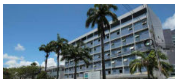
Meta do Instituto de Onco...