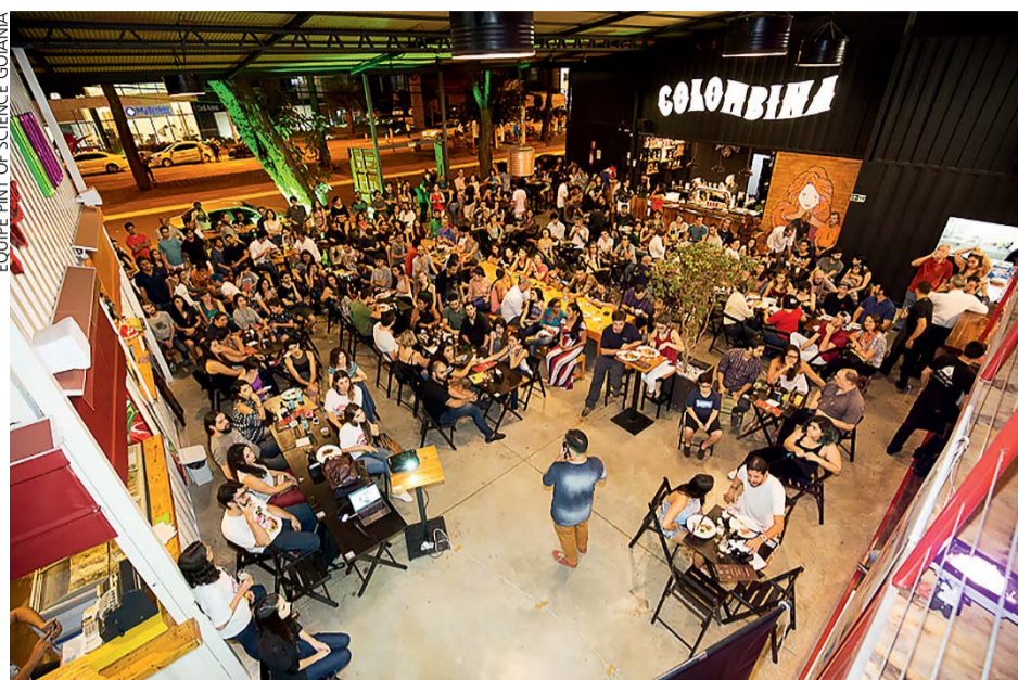
EQUIPE PINT OF SCIENCE GOIÂNIA

Carol Prado Imprensa Oficial – Conteúdo Editorial