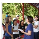
Alunos da rede básica de ensino no mundo da ciência na USP Ribeirão