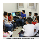
Casa da Ciência ainda precisa de novos pesquisadores

2º Vara Criminal da Comarca de Ribeirão Preto , adote um cientista , campus , Casa da Ciência , IEA-RP , mural , Pequeno Cientista