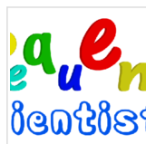
24º Mural da Casa da Ciência