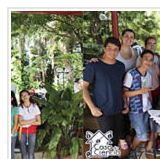
Ciência produzida na escola