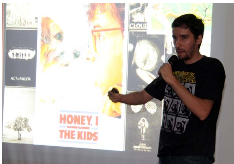
Entre vilões e heróis: como o cinema retrata o cientista? Imagem:

O objetivo do evento é utilizar trechos de filmes, séries e documentários para costurar as ideias e ligar os conceitos abordados nas apresentações. O enredo é dinâmico e cativante, e os narradores são professores e pesquisadores universitários. As apresentações, com uma hora de duração e 30 minutos de debate, são pensadas em um formato de storytelling , se distanciando do padrão de assistir a um filme ou documentário sobre um tema específico e só ao final discutir o assunto principal.