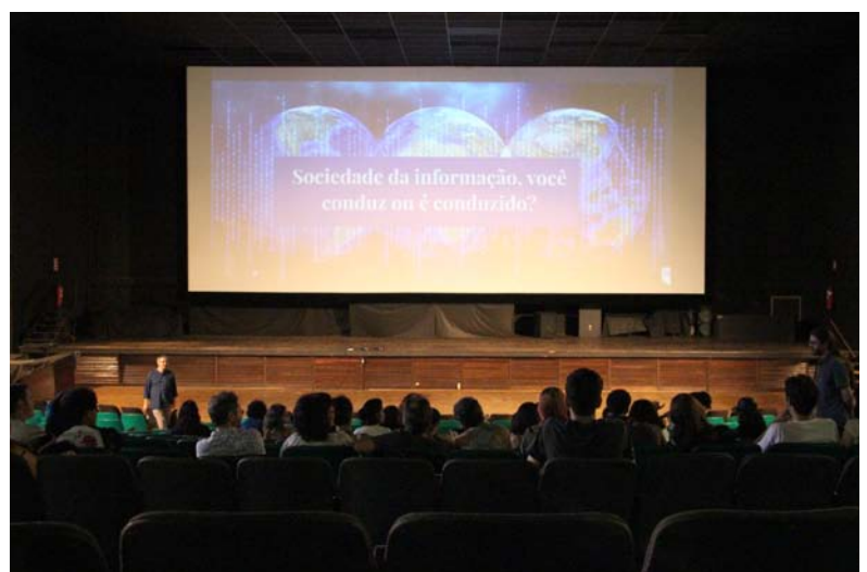
Sociedade da Informação: você conduz ou é conduzido? Imagem: Hugo

Unir ciência e cinema é a proposta do “Ciência com Pipoca”. O projeto, que está na terceira edição em Ribeirão Preto, convida o público e os palestrantes para esse desafio e prova que a ideia é um sucesso!