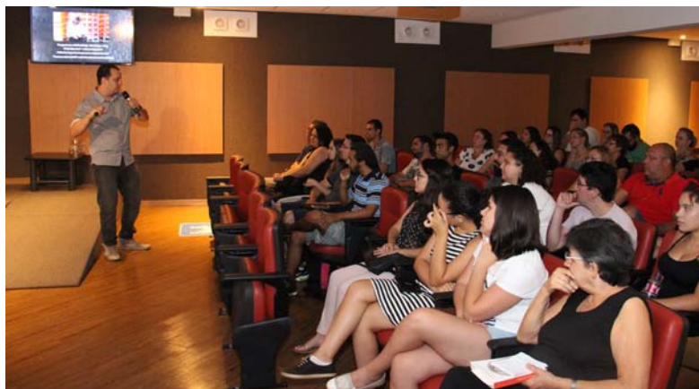
Genomas fantásticos e onde habitam: os limites da manipulação do DNA.

uma linguagem acessível a plateia, sem simplificações grosseiras, perda de qualidade conteúdo e infantilização. Seguindo essa proposta vários temas foram abordados, como: neurociência, robótica, radiação, sociedade da informação, genética, novas tecnologias e mídias sociais, consciência, comportamento humano; evolução biológica e etc.