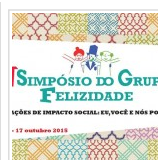
'Felicidade' e o voluntariado