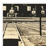
Verdes Infinitos Cafezais na FDRP