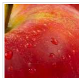
Seminário aborda epigenética