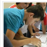
Férias com Ciência

CTC , Instituto de Ciências Biomédicas , palestra , parasitas humanos