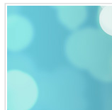
Seminário aborda doenças linfoproliferativas