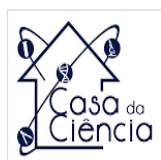
Memória do Ensino e Celularium