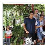
Ciência produzida na escola