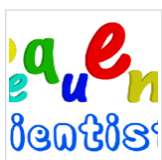
24º Mural da Casa da Ciência