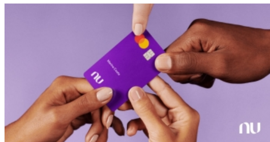
Cartão de crédito + conta digital. Do seu jeito.