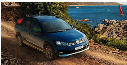
Saveiro. Pronta para tudo