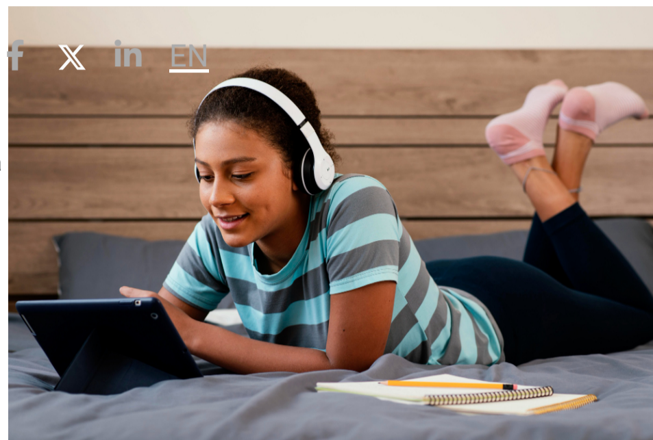
Iniciativa visa despertar o interesse dos jovens para a ciência por meio de discussões, experimentos e pesquisas

A iniciativa tem apoio do Centro de Terapia Celular (CTC) , um dos Centros de Pesquisa, Inovação e Difusão ( CEPIDs ) da FAPESP, e traz uma série de vídeos gravados por graduandos, pós-graduandos e pesquisadores da USP e de outras universidades, em que são apresentados conceitos das áreas em que atuam. Em cada encontro virtual também será solicitada uma pequena tarefa no final.