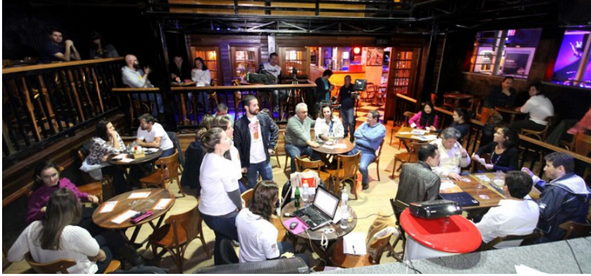
Discussão sobre o zika vírus em bar durante o Pint of Science, em São Carlos

O Brasil, país pioneiro na realização do evento na América Latina, teve sua primeira edição em 2015, quando o Instituto de Ciências Matemáticas e de Computação (ICMC) da USP realizou o evento em São Carlos. Aos poucos outros institutos se envolveram na iniciativa e passaram a promover o Pint Of Science em suas cidades. Em 2017, o festival se espalhou por 22 cidades brasileiras e discutiu temas como física quântica, alimentação infantil, nanotecnologia, big data, zika vírus, poeira estelar e buraco negro, por exemplo.