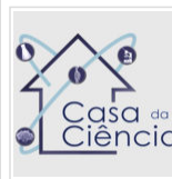
Casa da Ciência abre inscrições para pesquisadores