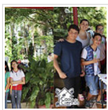
Ciência produzida na escola