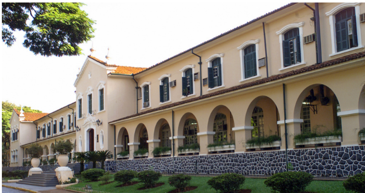
Fachada da Faculdade de Medicina de Ribeirão Preto

Avanços na ciência, atendimento à população e disseminação da cultura são marcas profundas nas sete décadas de história da Faculdade de Medicina de Ribeirão Preto (FMRP) da USP. Entre as ações de comemoração está a tradicional sessão solene no dia 25 de outubro, às 20 horas, no Theatro Pedro II, com apresentação da USP Filarmônica e lançamento do livro Faculdade de Medicina de Ribeirão Preto – Quarta Década .