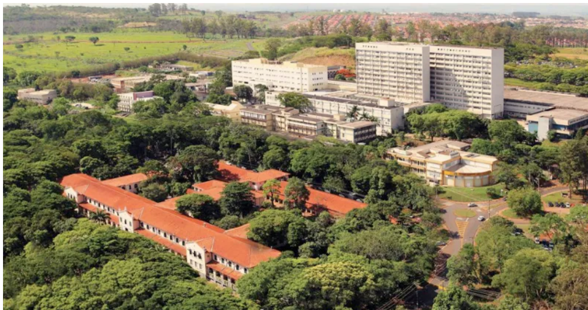
Visão aérea do complexo de saúde vinculado à Faculdade de Medicina de Ribeirão Preto – Foto: Divulgação/FMRP

Atualmente, a faculdade possui mais de 400 servidores, 300 docentes e 1.300 alunos inscritos nos cursos de graduação em Ciências Biomédicas, Fisioterapia, Fonoaudiologia, Informática Biomédica, Medicina, Nutrição e Metabolismo e Terapia Ocupacional. Já na pós-graduação, são mais de 1.400 pós-graduandos inscritos em diferentes programas voltados para a área da saúde.